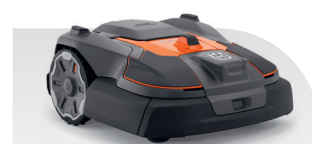
Automower® 580L EPOS®