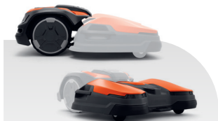
CEORA® 544 EPOS® + RZ 43M

970 54 90-01 14'990.00 970 61 44-01 9'990.00