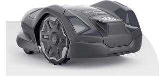
Automower® 310E NERA