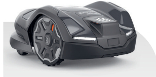
Automower® 405XE NERA