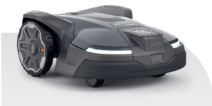
Automower® 450X NERA