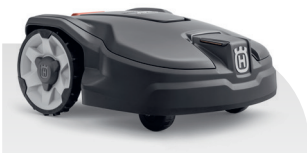
Automower® 315 MARK II