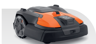
Automower® 580 EPOS®