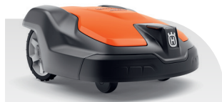
Automower® 520 EPOS®