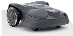
Automower® 320 NERA