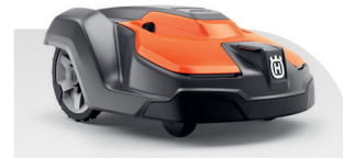
Automower® 550 EPOS®