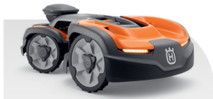
Automower® 535 AWD EPOS®