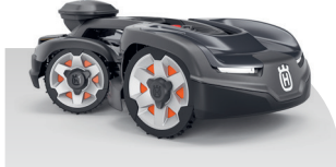
Automower® 435X AWD NERA