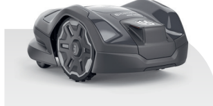
Automower® 305E NERA