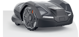
Automower® 410XE NERA