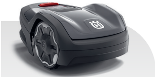
Automower® ASPIRE™ R4