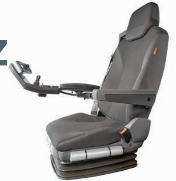
Optionaler Sitz für Extrakomfort - dieser spezielle Gesundheitssitz bietet dem Fahrer weitere Einstellmöglichkeiten, wie eine 2-fach Lordosenstütze, Sitzneigungs- und Sitzflächenlängenverstellung, 3-Punkt-Gürt, Sitzheizung und Rückenlehnen-Neigungsverstellung. Und natürlich sind auch die Armlehnen wie beim Standardsitz mehrfach verstellbar.

Mit Einsatz der optionalen Geschwindigkeitsregelanlage (Cruise control) ist ein Inchpedal integriert, sodass die Geschwindigkeit ohne Reduzierung der Motordrehzahl verringert werden kann. So wird bei gleichbleibendem Hydraulikdruck die Kehr- oder Mähleistung aufrecht erhalten, auch beim langsamen Umfahren von Hindernissen.